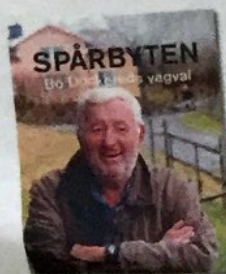
Omslaget till boken "Spårbyten".

” När vice statsministern såg kampanjen ringde han mig och sa: "Nu förlorar vi valet."