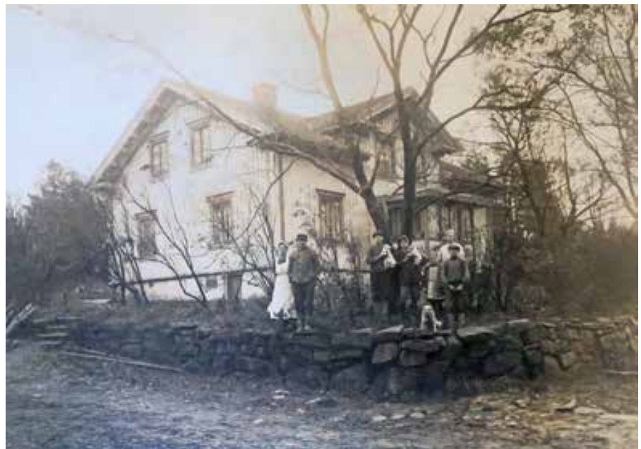
Gården Dockered förr.